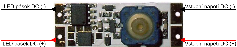
Obr.1 - Zapojení vývodů modulu stmívače

Vstupní napájecí napětí nesmí být vyšší než je maximální napájecí napětí použitého LED pásu. Při použití pro proudy nad 5A důkladně proleťte prokovky na vstupních i výstupních pájecích bodech.